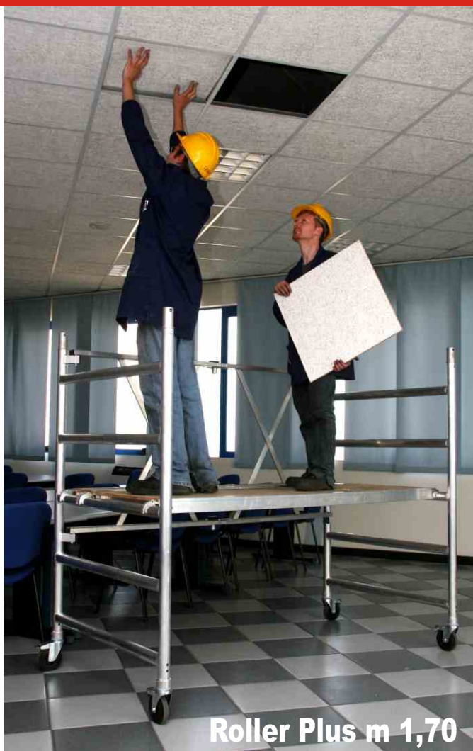
Roller Plus m 1,70